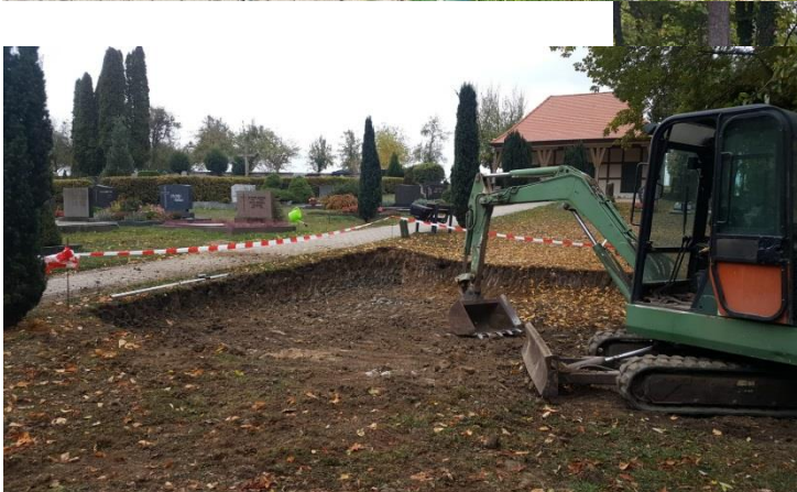
Ausheben der Erde