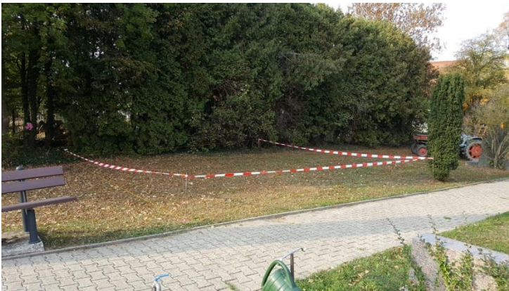
Abstecken der Fläche