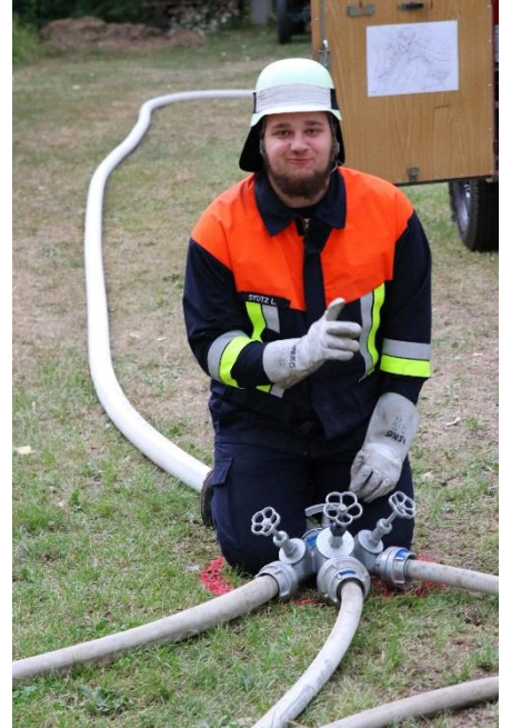
Text: M.D.